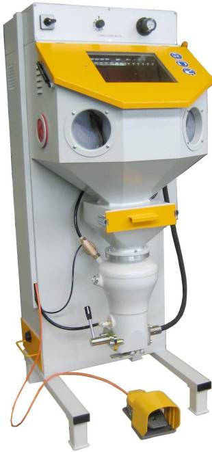
MasterClean XS 55

Sablux Technik AG Bramenstr. 14 CH-8184 Bachenbülach Suisse Tél. 043 411 44 22 Fax 043 411 44 23 http://www.sablux.ch