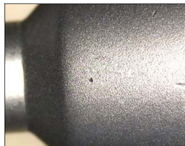
Ein Düseneinsatz vor und nach einer Zweistufen-Microstrahlbehandlung